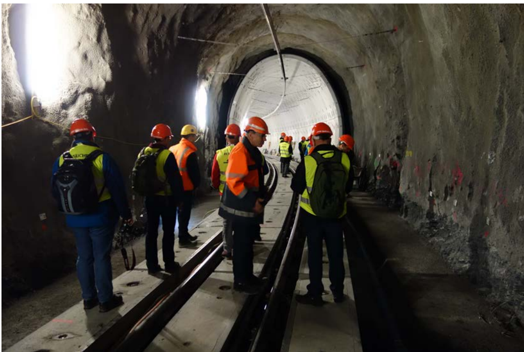
Neubau der Verkleidung des Gletscheras-Tunnels mit vorfabrizierten Betonelementen (Foto: Martin Strobel).