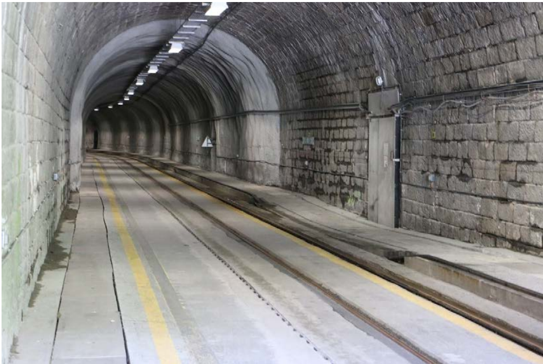
Der Tunnel des Montets verbindet Vallorcine mit Chamonix und ist mit einer seitlichen Stromschiene elektrifiziert. Ist die Passstrasse nicht befahrbar, muss der Bahnbetrieb zeitweise unterbrochen werden und der Strassenverkehr wird durch den Bahntunnel umgeleitet. Dabei muss vorgängig die Stromschiene spannungsfrei geschaltet und geerdet werden.

Am 7. Oktober fand der traditionelle Herbstausflug der welschen Kollegen bei Juracime in Cornaux statt. Die rund 30 teilnehmenden Kollegen bekamen einen Einblick in den Fabrikationsprozess der Zementherstellung.