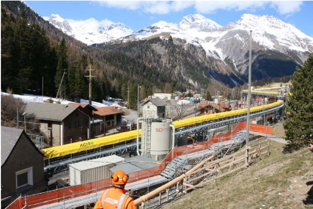
Der Installationsplatz Preda ist so eingerichtet, dass praktisch alle Transporte über die Bahn abgewickelt werden können.

Am 29. April fuhren 50 Mitglieder nach Preda um die Baustelle für den neuen Albulatunnel zu besichtigen. Nach dem Mittagessen teilten sich die Teilnehmer in zwei Gruppen auf. Die einen besuchten den Neubau des Gletscheras-Tunnel bei Filisur und die anderen das Bahnmuseum Bergün.