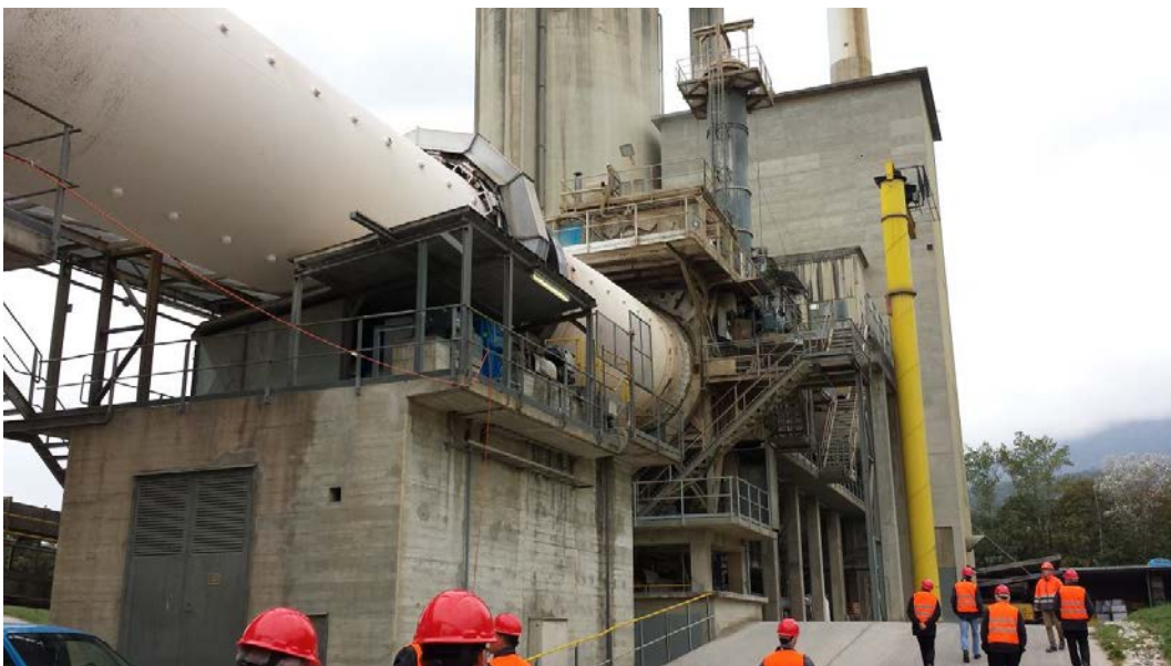
Oberes Ende des Drehofens des Zementwerkes in Cornaux.

Am 7. Oktober fand der traditionelle Herbstausflug der welschen Kollegen bei Juracime in Cornaux statt. Die rund 30 teilnehmenden Kollegen bekamen einen Einblick in den Fabrikationsprozess der Zementherstellung.