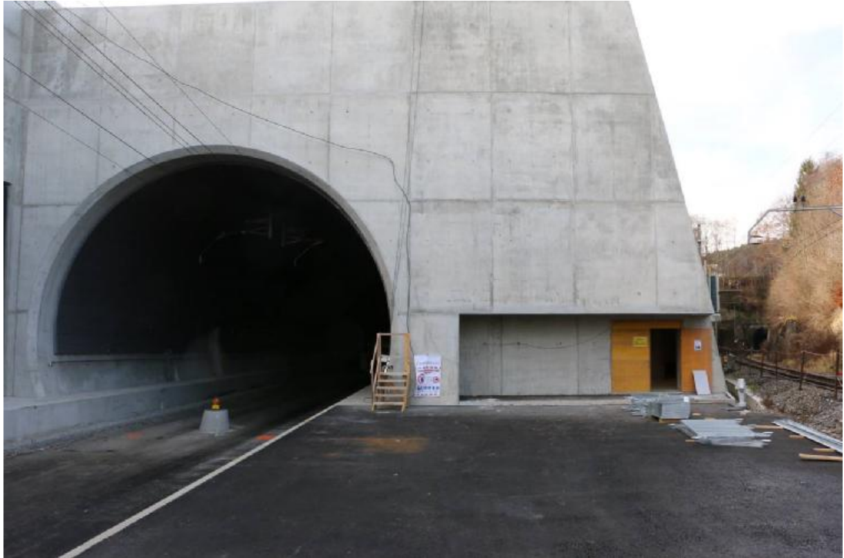
Les portails est du nouveau et ancien tunnel de Rosshäusern.

J'aimerais remercier le comité comme les organisateurs locaux pour le travail accompli. Le nombre de participants nous montre que le choix des programmes correspond bien aux attentes.