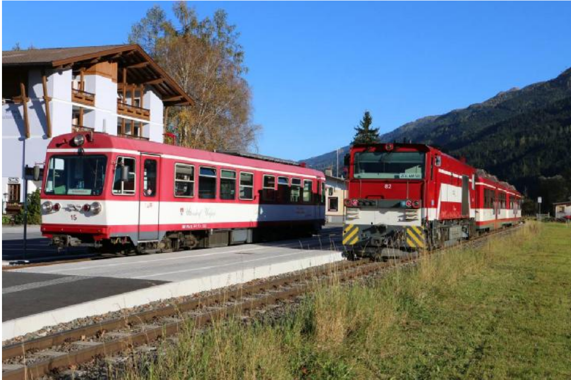
Le Pinzgauer Lokalbahn circule également avec un système de gestion du trafic par radio et ne dispose pas de signalisation extérieure.