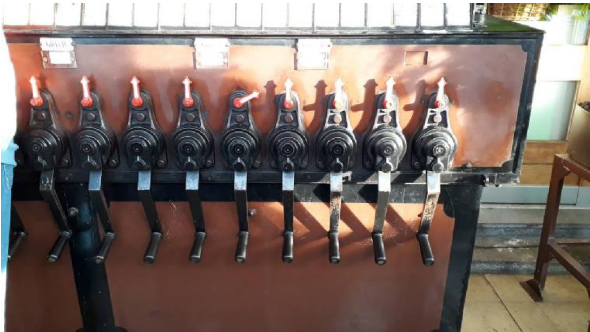
Le vieil enclenchement mécanique de Chiètres qui est toujours fonctionnel.

Le 24 novembre colloque s'est déroulé à Rosshäusern et Chiètres. Une soixantaine de participants ont visité le tunnel de Rosshäusern en cours d'équipement de la technique ferroviaire et particulièrement les installations d'évacuation au milieu du tunnel. A Chiètres l'association qui a préservée l'enclenchement mécanique nous permis de nous exercer comme aiguilleurs à l'ancienne. Les deux groupes se sont retrouvés pour le repas commun.