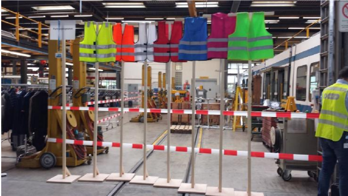
La visite des ateliers centraux se déroulait en groupes qui se distinguaient par des gilets de couleur différente.