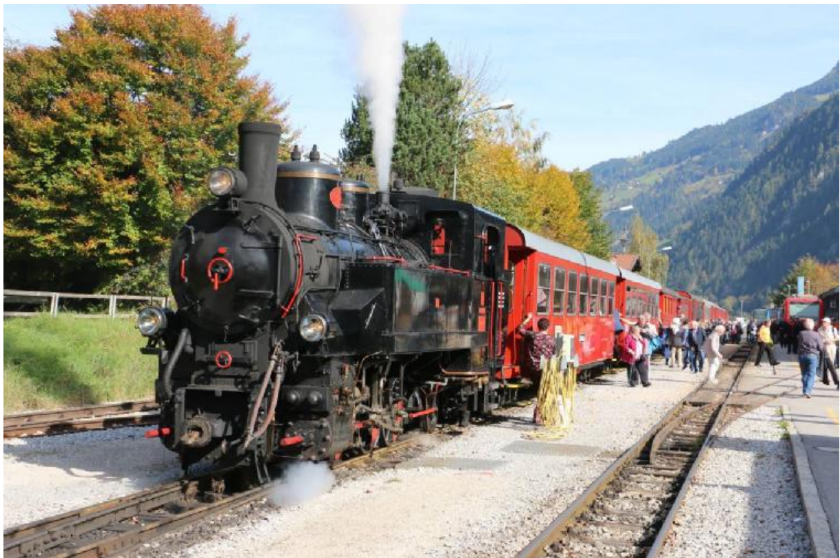
Train à vapeur du Zillertalbahh également équipé du système de gestion du trafic par radio.