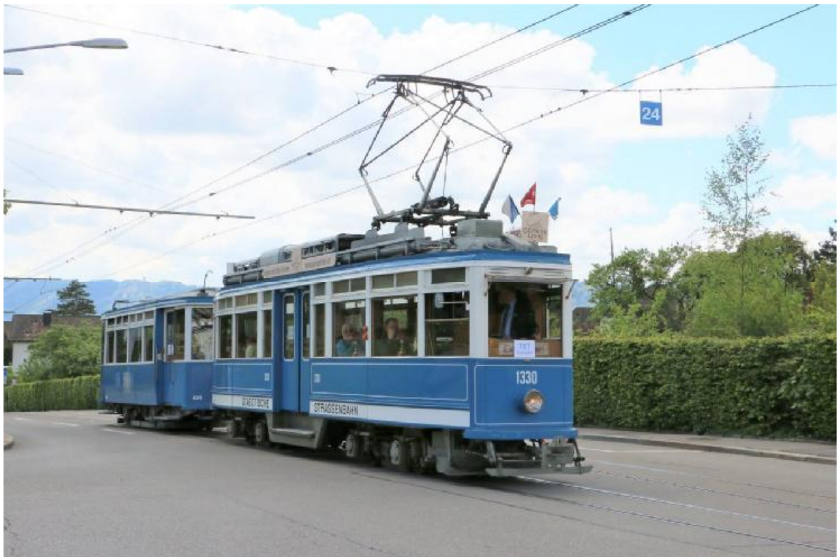
Unsere Extradfahrt mit einem der zwei Elefanten zum Zoo.

Vom 12. bis 15. Oktober fand die zweijährliche Auslandsexkursion in Österreich und Bayern statt. Gut 30 Teilnehmer haben die Verkehrsbetriebe in Innsbruck, die Zillertalbahn, die Pinzgauer Lokalbahn und abschliessend die Zugspitzbahn besucht. Bei den beiden österreichischen Schmalspurbahnen wurde uns speziell der in der Schweiz nicht bekannte Funkleitbetrieb im Detail vorgestellt. Eine Dampffahrt zum Achensee ergänzte das Programm. Bei der Zugspitzbahn hatten wir einen Extradzug mit der vierachsigen Zahnradlokomotive, die für den Neubau der Luftseilbahn beschafft wurde. Wir konnten die noch im Bau befindliche Bergstation der neuen Luftseilbahn besichtigen.