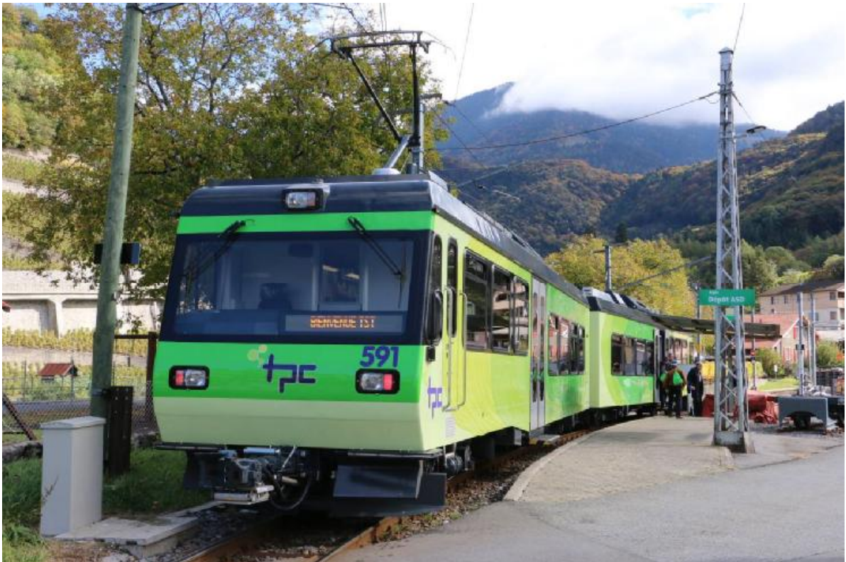
Der TST-Extrazug mit dem umgebauten Zahnrad Doppeltriebwagen in Aigle Dépôt ASD.

Infrastruktur vorgestellt. Für das gemeinsame Essen fahren wir mit einem umgebauten Fahrzeug ins Baudienstzentrum, dem alten ASD-Depot.