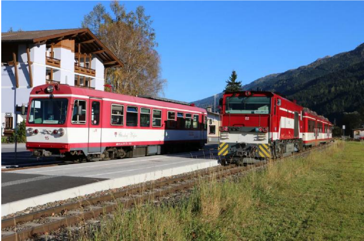
Die Pinzgauer Lokalbahn fährt auch mit Zugleitbetrieb und verfügt über keine Aussensignale.