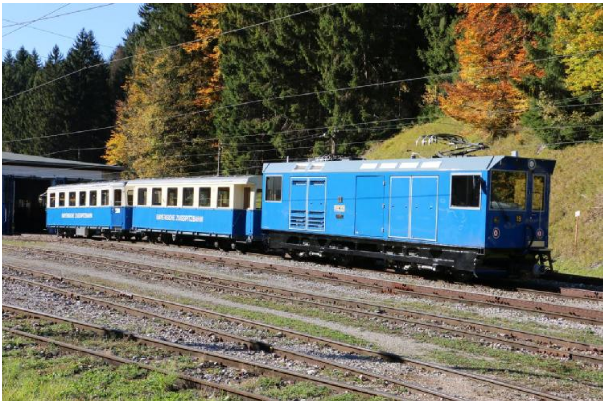
Die vierachsige Zahnradlokomotive der Zugspitzbahn, welche für den Neubau der Luftseilbahn beschafft wurde.

Am 6. Oktober fand der traditionelle Herbstausflug der welschen Kollegen bei den Transports Publics du Chablais statt. Dabei wurde die Modernisierung der Zahnradtriebwagen von 2001 und die neue gelieferten Gelenktriebwagen und Zweikraftlokomotiven für die Instandhaltung der