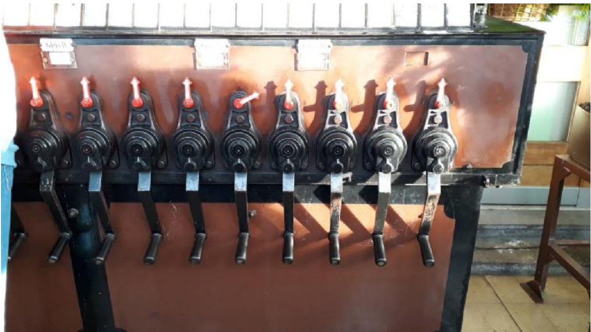
Das alte, immer noch betriebstüchtige Befehlsstellwerk in Kerzers.

Am 24. November fand eine Fachtagung im Raum Rosshäusern und Kerzers statt. Die rund 60 Teilnehmer besichtigten den in Fertigstellung befindliche Rosshäuserntunnel mit seiner in der Tunnelmitte befindlichen Rettungsstelle. In Kerzers konnten wir das alte mechanische Stellwerk, das von einem Verein betrieben wird, besichtigen und uns selber als Fahrdienstleiter üben. Beide Gruppen trafen sich zum gemeinsamen Mittagessen.