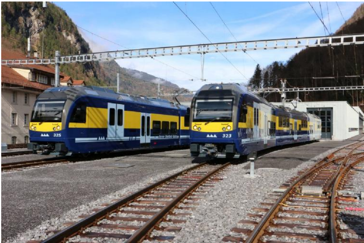
Neue Gelenkzahnradtriebwagen vor dem erweiterten Depottrakt in Zweilütschinen.

Der Vorstand traf sich am 11. Mai in Zürich und am 15. Dezember in Langenthal um die Vereinsaktivitäten zu organisieren. Die erste Fachtagung am 23. März führt uns zur BOB nach Zweilütschinen. Die rund 100 Teilnehmer konnten die neuen Zahnradtriebswagen von Stadler ausgiebig besichtigen. Weiter wurde die Anpassungen an den bestehenden Gelenksteuerwagen wie an den Zahnradtriebwagen aus den achtziger Jahren vorgestellt. Alle Fahrzeuge erhalten neue automatische Kupplungen und ein den neuesten Fahrzeugen angepasstes Fahrgastinformationssystem. Die Instandhaltung der nun grösstenteils aus Gelenkfahrzeugen bestehenden Fahrzeugflotte wurden Depot und Werkstätte in Zweilütschinen erweitert.