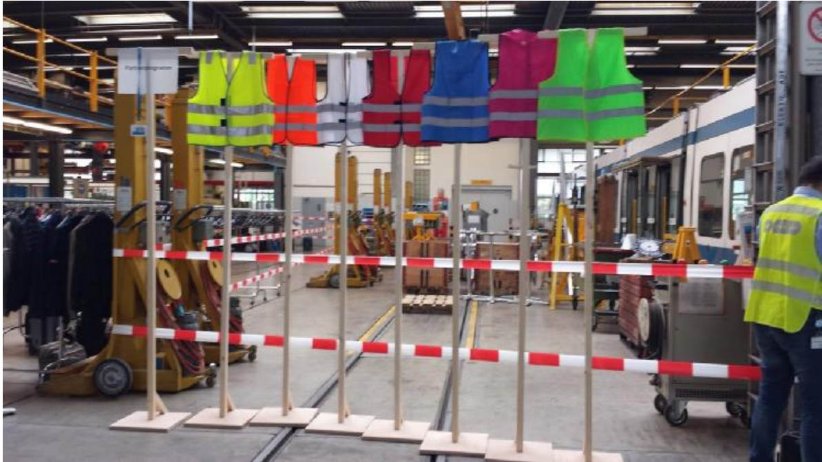
Die Besichtigung der VBZ erfolgte in Gruppen. Um die verschiedenen Gruppen auseinanderzuhalten, hatten die VBZ verschiedenfarbige Warnwesten organisiert.