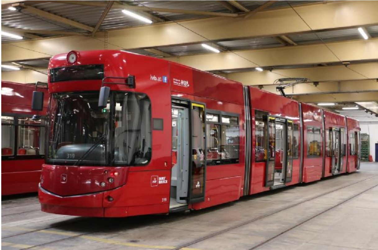
Neue Remise der Innsbrucker Verkehrsbetrieb.