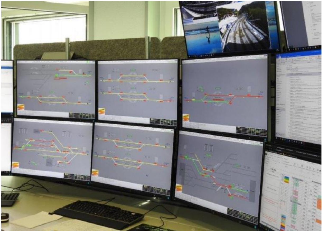
Zentrale Leitstelle in Wilderswil.