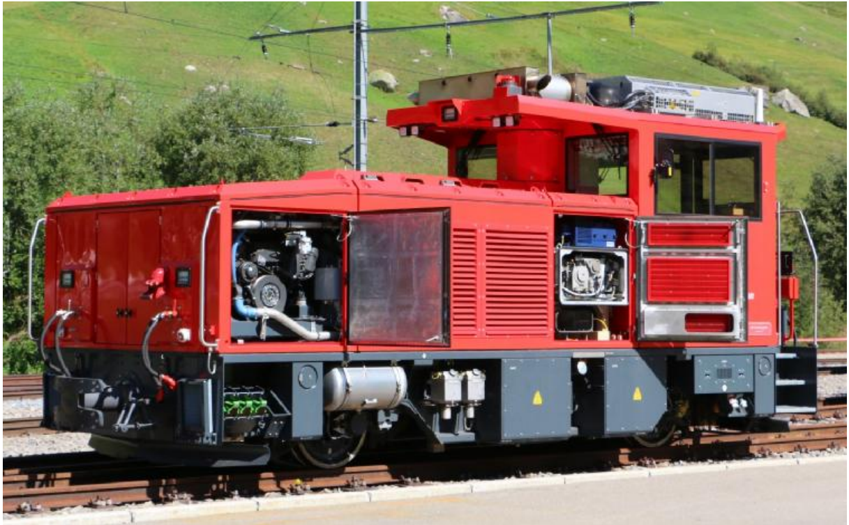
MGB HGm 2/2 702 (die 704 war im Mattertal im Einsatz) in Realp.

Am 30.08.2019 laden Matterhorn Gotthard Bahn und Dampfbahn Furka Bergstrecke zur Fachtagung 704/704 ein. Dabei geht es um die Vorstellung von zwei Zahnradlokomotiven mit der gleichen Nummer, die 2019 in Betrieb gesetzt wurden. Einerseits die vier von Stadler erbaute HGm 2/2 für die Infrastrukturinstandhaltung und die 1923 von SLM für Vietnam gebaute Dampflokomotive, die durch DFB-Freiwillige der Dampfbahn in jahrelanger Arbeit restauriert wurde. Gleichzeitig erfuhren wir, wie der Furka-Basistunnel modernisiert wird und den heutigen Sicherheitsanforderungen angepasst wird und die Tunnelrettung neu aufgebaut ist.