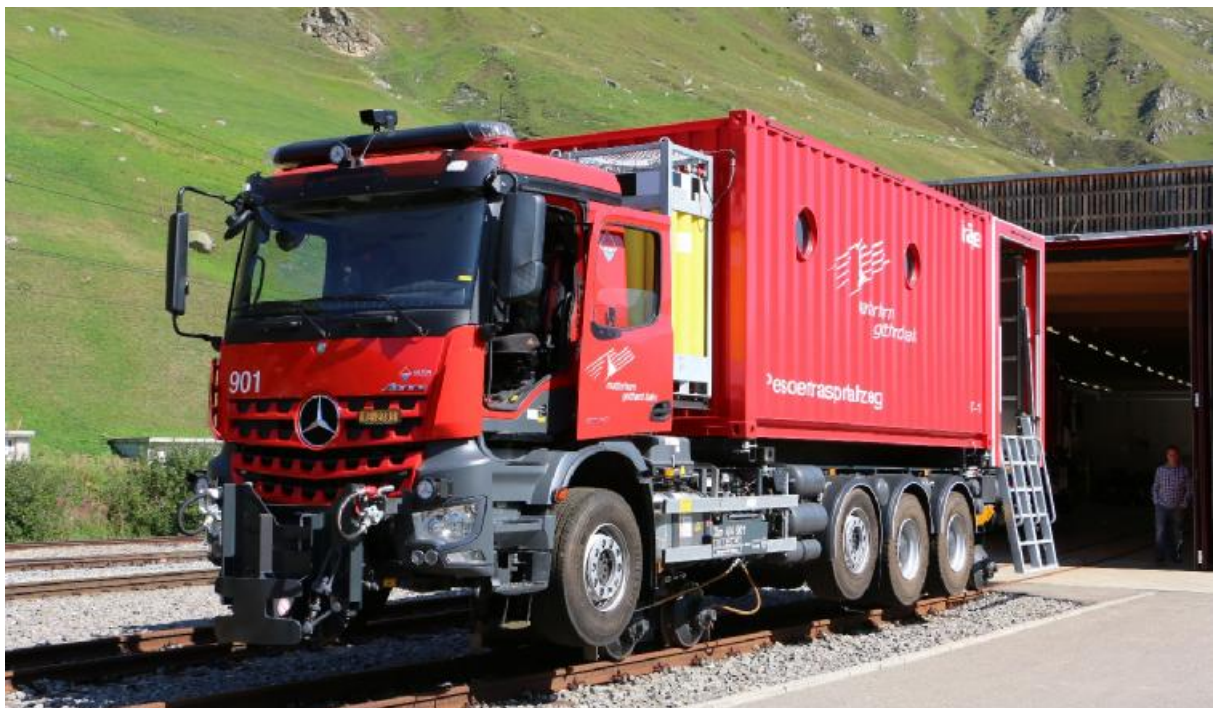
Zwei-Weg-Lastwagen der Tunnelrettung mit Wechselcontainer vor dem Einsatzgebäude in Realp.