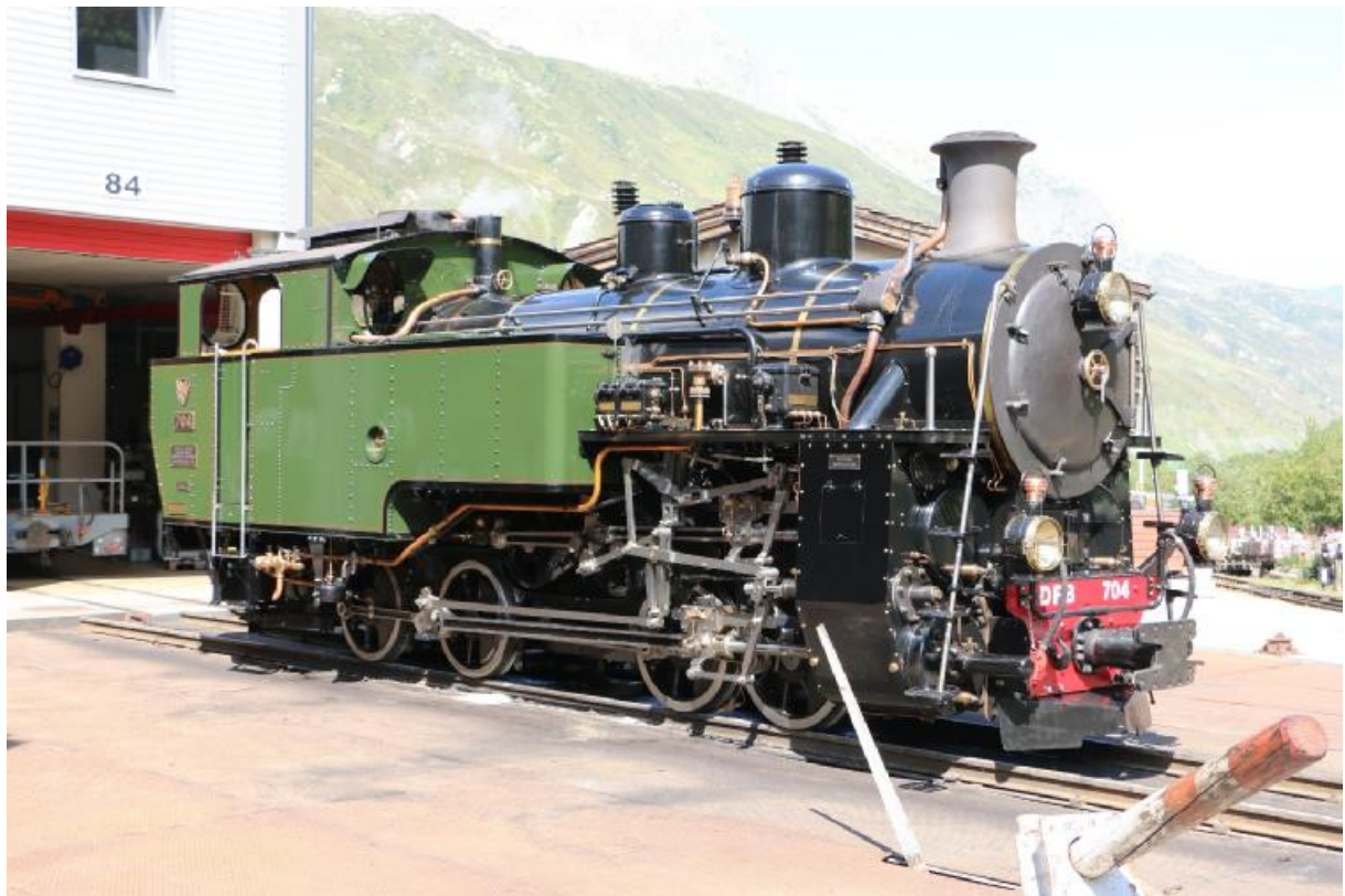
DFB HG 4/4 704 auf der Drehscheibe in Realp.

Der Herbstausflug der Romands fand leider zum zweiten mal nicht statt, da niemand die Organisation durchführen wollte.