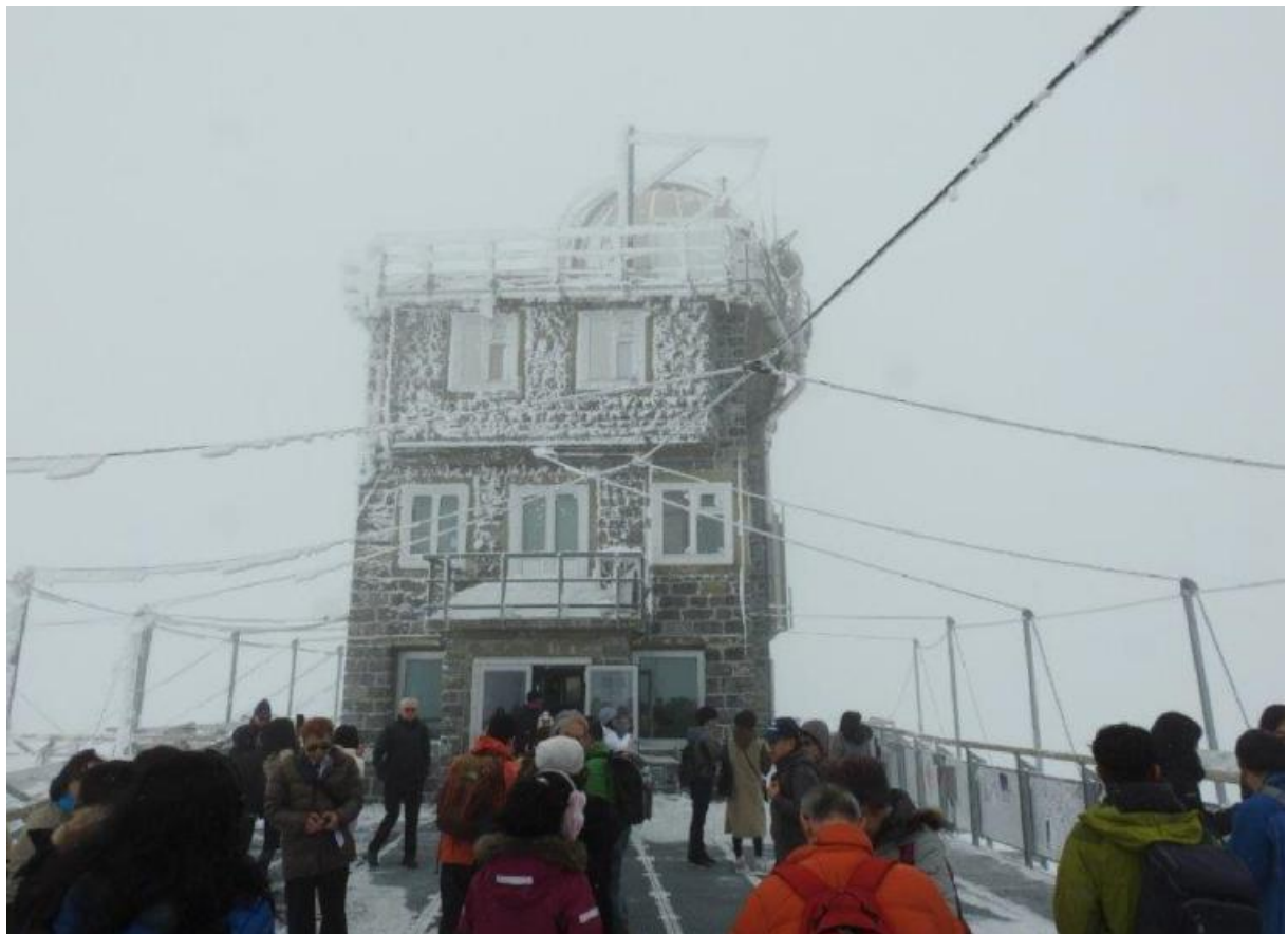
Die Wetterverhältnisse am Samstag auf dem Jungfraujoch.