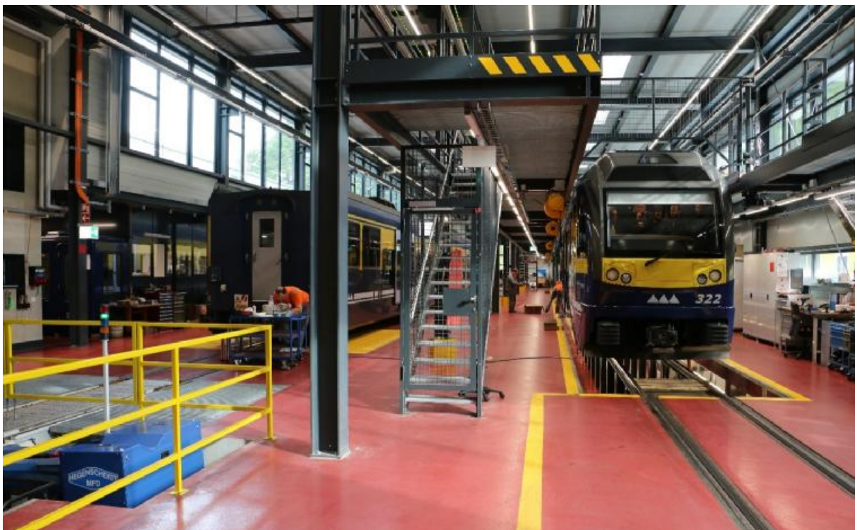
Blick in die ausgebaute und modernisierte BOB-Werkstätte in Zweilütschinen.

Zur Jahresversammlung vom 16. – 18.05.2019 luden die JungfrauBahnen nach Interlaken ein. Wie jedes Jahr war die Teilnehmerzahl beachtlich. Für die verschiedenen Fachdisziplinen (Sicherungsanlagen, Traktion und Infrastruktur) wurde am Freitag je ein separates Besuchsprogramm angeboten. Für Partner wurde auch ein Kulturprogramm geboten. Am Samstag fuhren wir gemeinsam aufs JungfrauJoch zum Mittagessen.