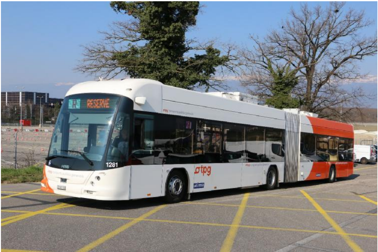
Unser Elektrobus «TOSA» von Hess und ABB für die Extrafahrt beim Flughafen Genf.

Zur Jahresversammlung vom 16. – 18.05.2019 luden die JungfrauBahnen nach Interlaken ein. Wie jedes Jahr war die Teilnehmerzahl beachtlich. Für die verschiedenen Fachdisziplinen (Sicherungsanlagen, Traktion und Infrastruktur) wurde am Freitag je ein separates Besuchsprogramm angeboten. Für Partner wurde auch ein Kulturprogramm geboten. Am Samstag fuhren wir gemeinsam aufs JungfrauJoch zum Mittagessen.