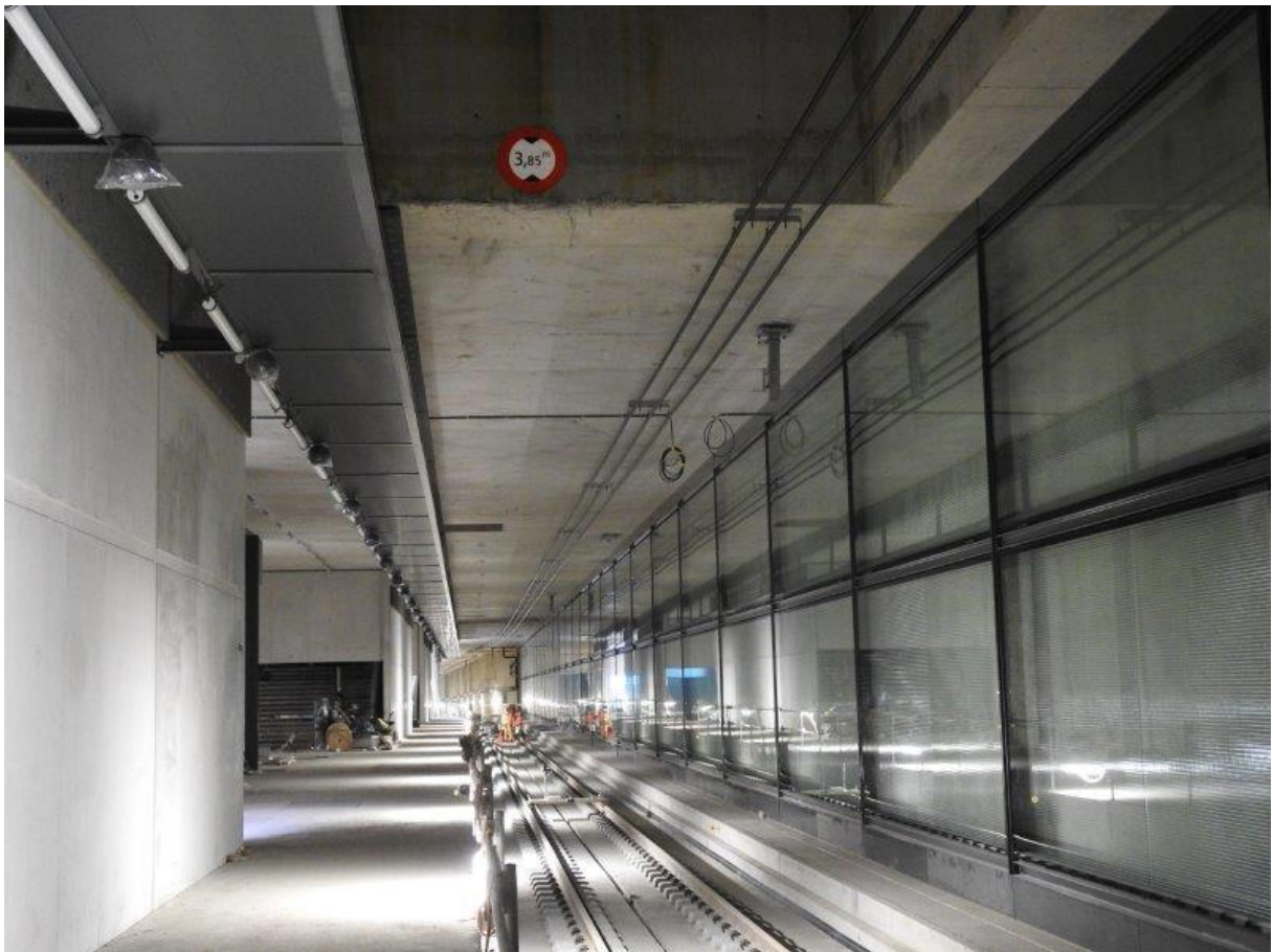
Der in Ausrüstung befindliche CEVA-Bahnhof Eaux-Vives.

Am 29.03.2019 trafen sich rund 80 Teilnehmer in Genf zur Besichtigung der internationalen Neubaustrecke Cornavin – Eaux-Vives – Annemasse und zur Besichtigung des Projektes Elektrobus TOSA der TPG. Die CEVA-Verbindung war kurz vor der Fertigstellung und wurde Mitte 2019 dem zukünftigen Betreiber, SBB Infrastruktur, übergeben, um die Versuchsfahrten und die Personalausbildung durchzuführen. Mit einem Elektrobus befuhren wir die Linie 23 und gingen anschliessend ins Depot Jonction, wo auch noch ein für Nantes bestimmter Doppelgelenkbus Typ TOSA zu besichtigen war.