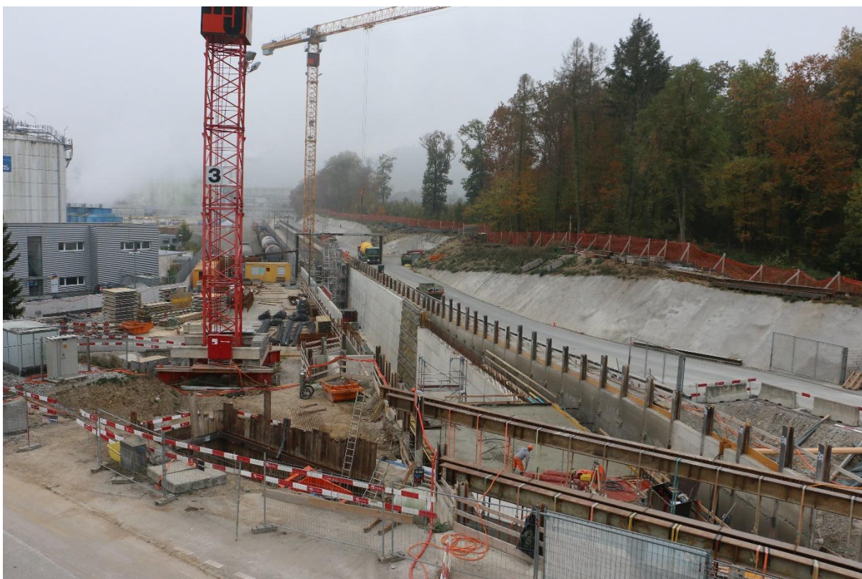
Chantier du nouveau raccordement du port Auhafen à la gare de triage CFF de Bâle.

Le deuxième colloque a eu lieu le 19 octobre 2018 à Bâle. Nous avons visité le projet d'extension du chemin de fer portuaire des deux Bâle. Pour l'amélioration de la viabilité du port de Birsfelden, un deuxième raccordement au réseau CFF est en construction côté sud. Un projet pour un troisième bassin portuaire à Kleinhüningen avec une nouvelle gare de transbordement de containers est à l'étude.