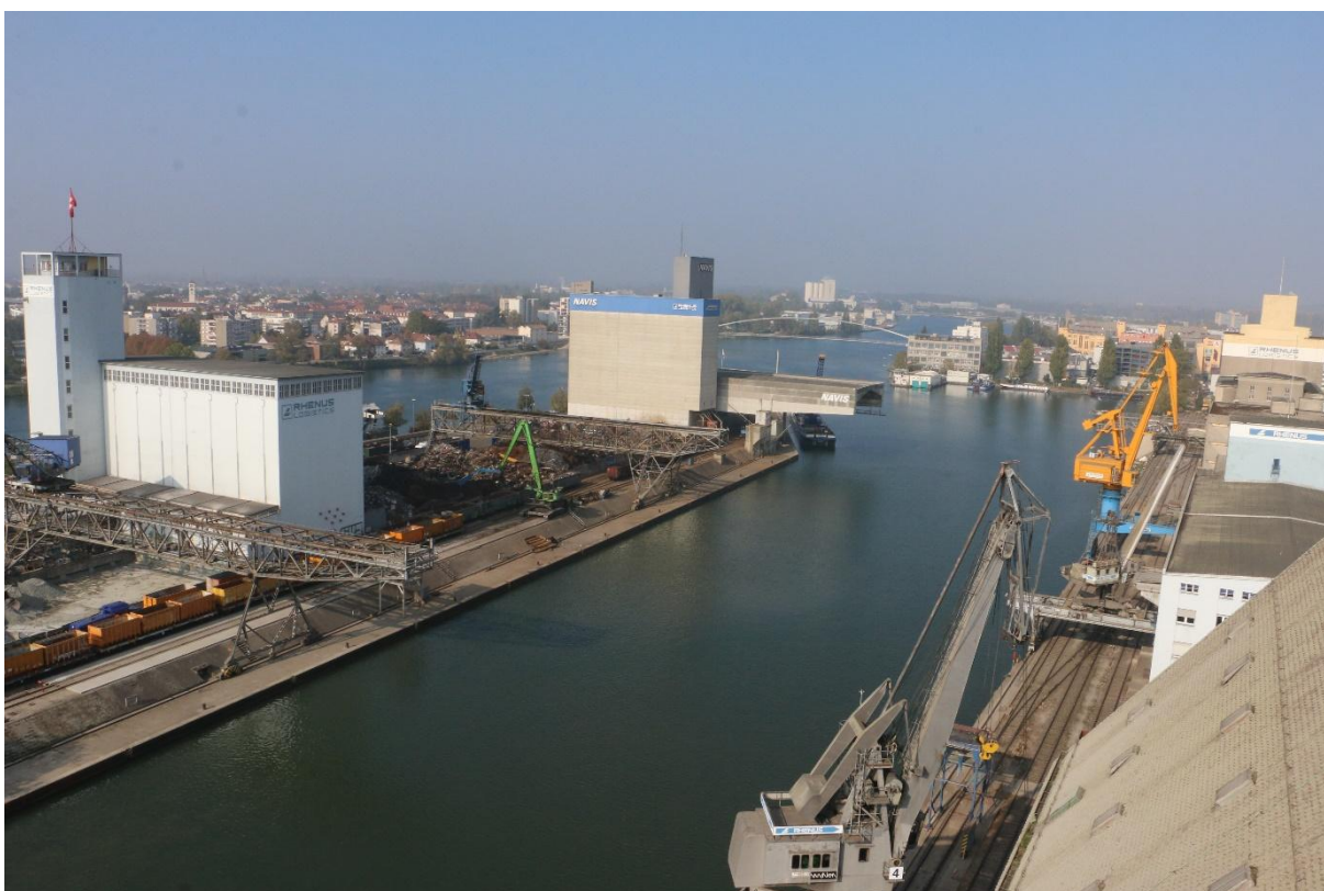
Vue depuis le silo Bernoulli dans le bassin portuaire 1 de Bâle Kleinhüningen.