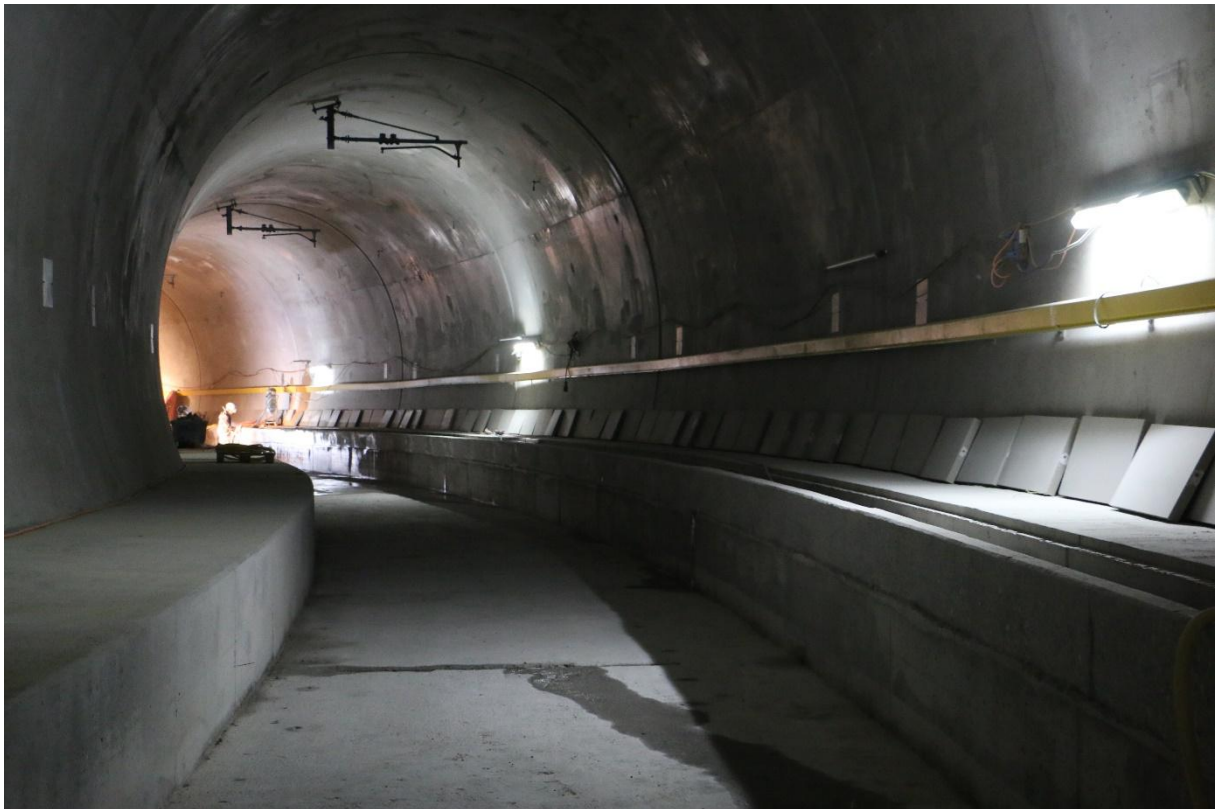
Der im Rohbau fertiggestellte Riethüslitunnel.

Am 4.05.2018 besichtigten wir den Bau der Durchmesserlinie der Appenzeller Bahnen in St. Gallen sowie im Depot Speicher die neuen Fahrzeuge des Typs Tango, die den Betrieb auf der Strecke Speicher – St.Gallen – Appenzell übernehmen werden.