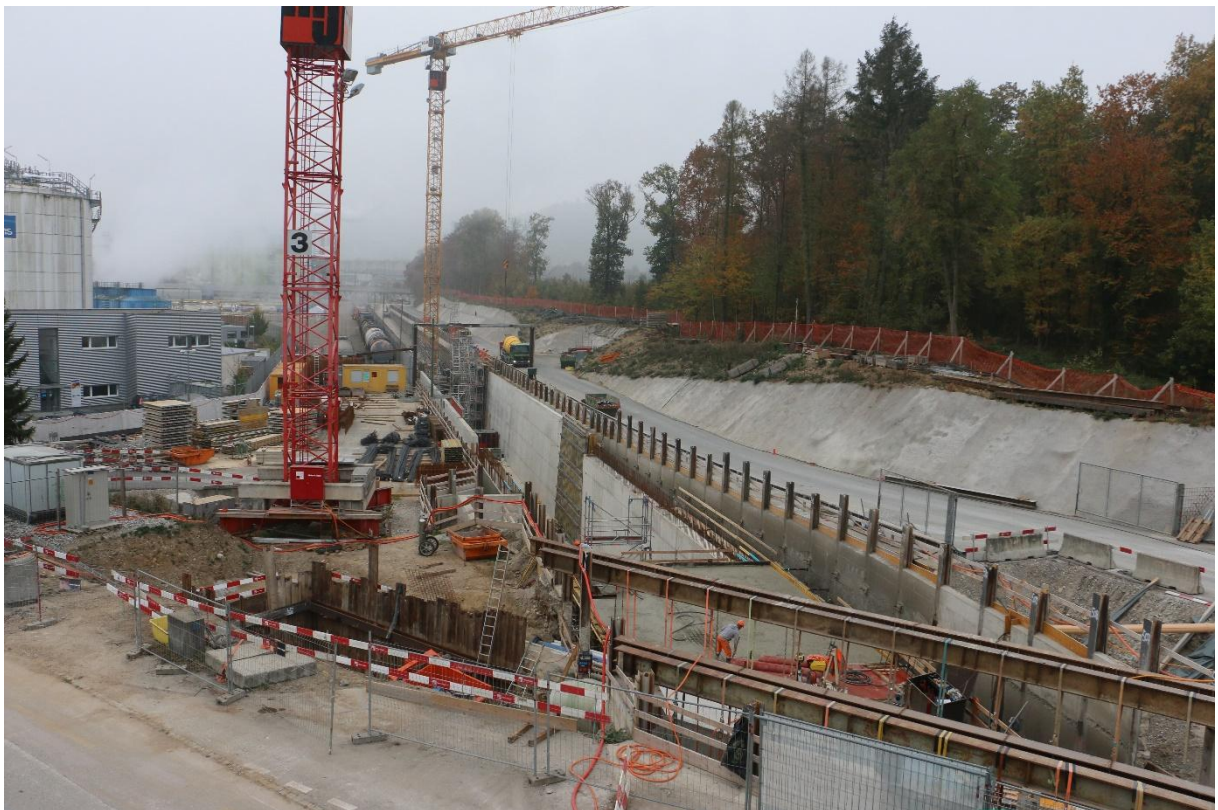
Baustelle der neuen Südanbindung des Auhafens an den SBB Rangierbahnhof Basel.

Am 19.10.2018 fand die zweite Fachtagung im Raum Basel statt. Wir besichtigten die Ausbauprojekte der Hafenbahn beider Basel. Um die Erschliessung von Birsfelden Hafen zu verbessern, wird eine zweite Anbindung an das SBB-Netz im Süden gebaut. In Kleinhüningen gibt es ein Projekt für ein drittes Hafenbecken mit einem neuen Containerumschlagbahnhof.