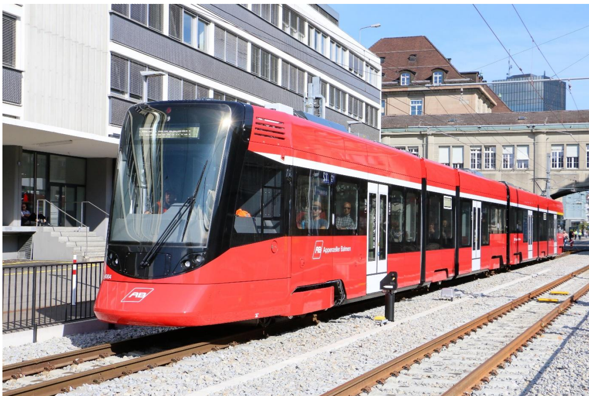
Tango der Appenzeller Bahnen in St. Gallen.

Die Jahresversammlung vom 7.06.2018 bis 9.06.2018 in Solothurn war von Aare Seeland mobil organisiert worden. Das gebotene Programm hat viele Mitglieder angezogen und die Besichtigungen für die Fachgebiete Traktion, Infrastruktur und Sicherungsanlagen sowie das Partnerprogramm wurden von den Teilnehmern als sehr interessant befunden. Ich möchte den Organisatoren bei ASm für die perfekte Organisation nochmals bestens danken.