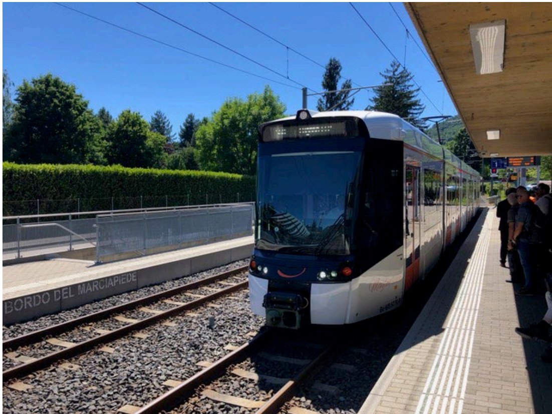
Nouveau matériel Tramlink des FLP