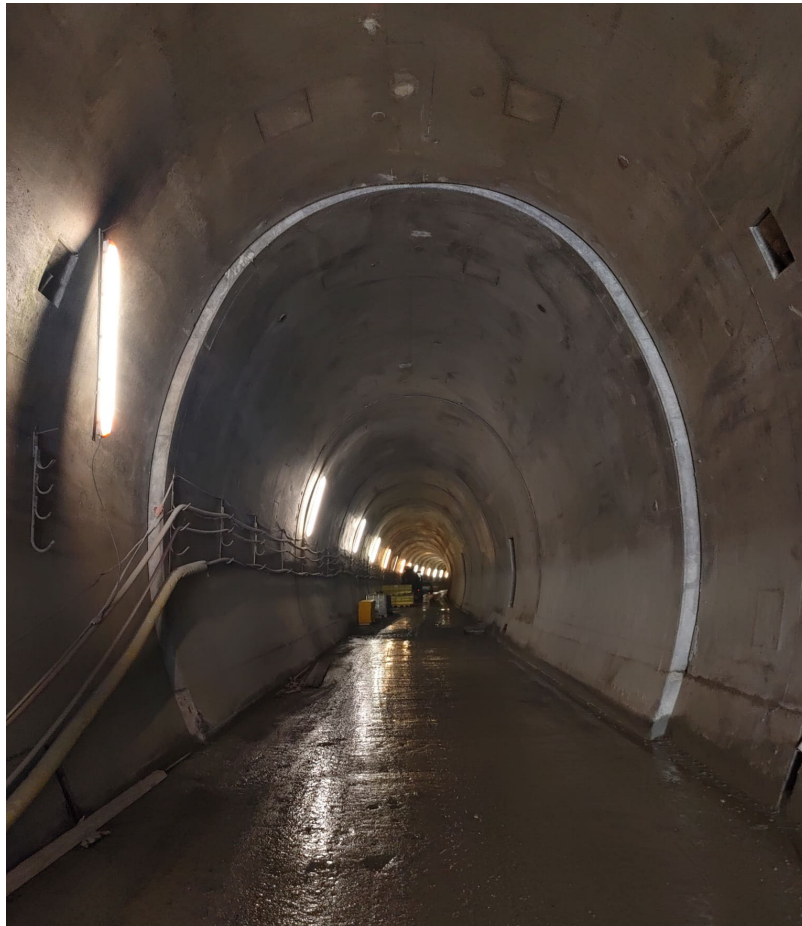
Le programme infrastructure comprenait la visite du tunnel de l'Albula II, encore sans équipement ferroviaire

Le 10.06.2022, les FLP et les TPL nous ont invités à Lugano. Une cinquantaine de membres de la TST se sont retrouvés au Tessin. La visite comprenait le funiculaire reliant la ville à la gare et une présentation des nouveaux développements autour des transports publics, avec notamment la création d'une ligne de tramway à Lugano. La suite de la journée s'est déroulée sur le FLP où les nouveaux véhicules Tramlink ont été présentés dans les emprises du dépôt d'Agno