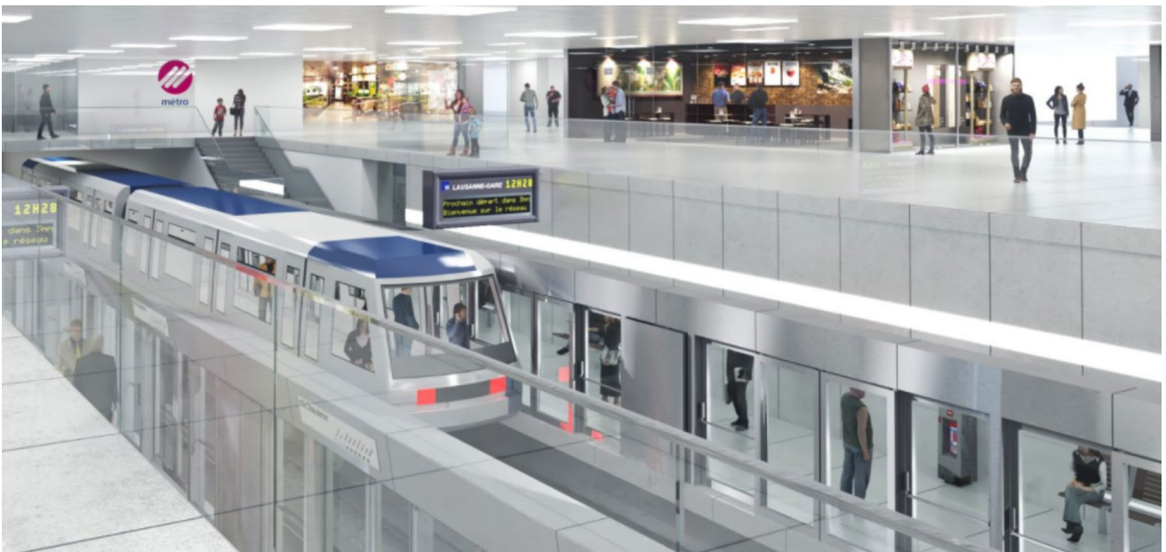
Métro automatique à Lausanne

Le 29.04.2022, ce sont environ 70 participants qui ont pris part au colloque en ligne au sujet des axes forts autour des transports de la région Lausannoise. Les transports publics de Lausanne (TL) ont présenté les grands projets en cours, notamment la création d'un tramway reliant Renens à Lausanne. Auparavant, la dernière circulation d'un tramway dans cette ville remonte à 1964. L'accès du LEB en ville est intégralement déplacé en sous-sol, permettant de mettre fin aux problèmes liés à l'utilisation du même tançons par la route et le rail. Le métro automatique M2 se trouve devant un programme d'assainissement et l'extension du réseau avec le futur M3 qui est en phase d'étude.