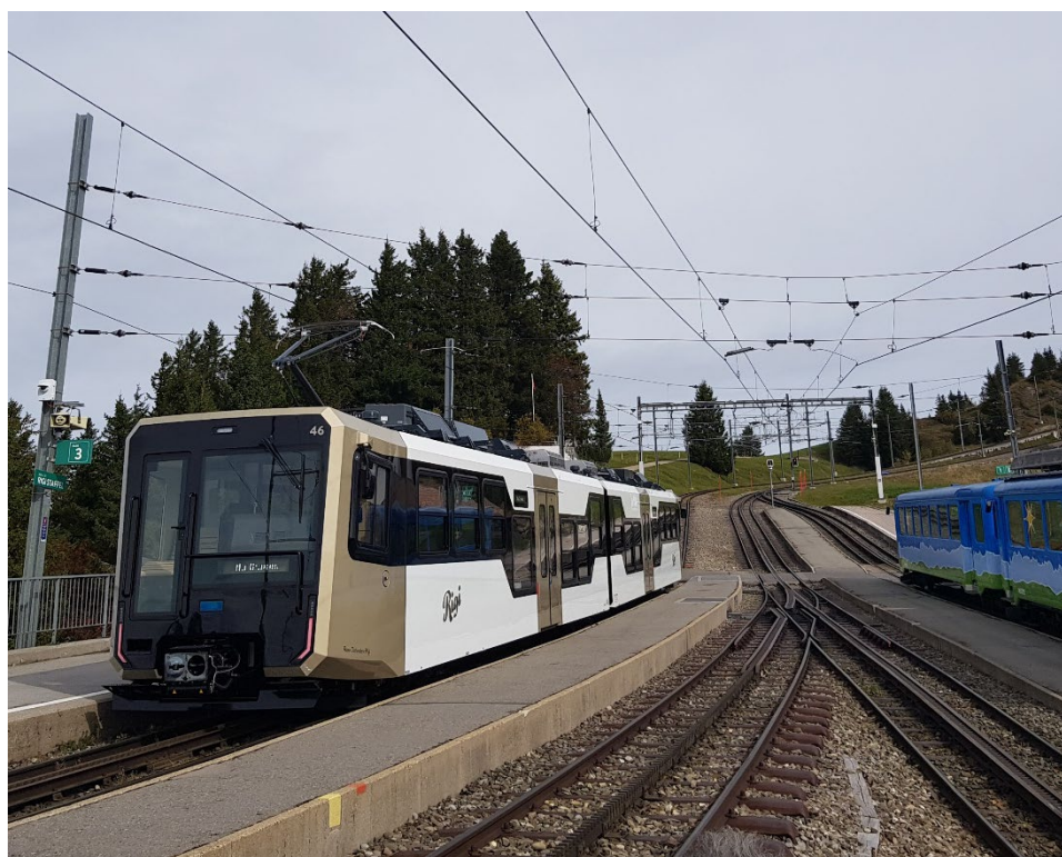
Voyage à bord d'une automotrice moderne pour la montée

Le dernier colloque de l'année s'est tenu le 14.10.2023 au chemin de fer du Rigi. Ce sont environ 60 membres de la TST qui ont embarqués à bord du bateau à Lucerne. Celui-ci nous a conduit à Vitznau. Durant la visite du dépôt, la maintenance du chemin de fer à crémaillère a été présentée. L'éventail de véhicules présent retraçait toute l'histoire des chemins de fer sur le Rigi, de la locomotive à vapeur jusqu'à l'automotrice moderne. Le repas de midi a été pris au sommet, avant de redescendre cette fois-ci sur Art-Goldau où les participants ont pu prendre congé dans l'enceinte du dépôt.