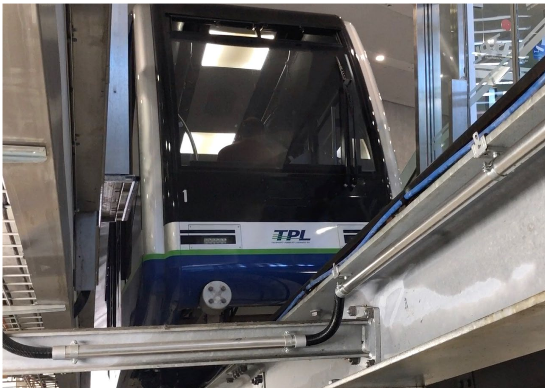
Une vue inhabituelle pour le voyageur : le funiculaire des TPL à Lugano

Le colloque le plus fréquenté de l'année a eu lieu le 26.08 auprès du chemin de fer du Pilatus. Près de 90 membres se sont retrouvés à Alpnachstad. La modernisation de ce chemin de fer avait fait l'objet en 2021 d'un colloque en ligne. Le résultat a pu être observé sur place. Après la visite du dépôt et la présentation du nouveau système de gestion du trafic, nous nous sommes rendus au