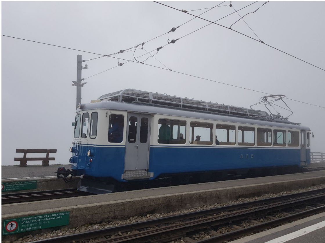
Changement de météo et d'époque: automotrice historique pour la descente

La sortie des Romands n'a malheureusement pas eu lieu, faute d'organisateur.