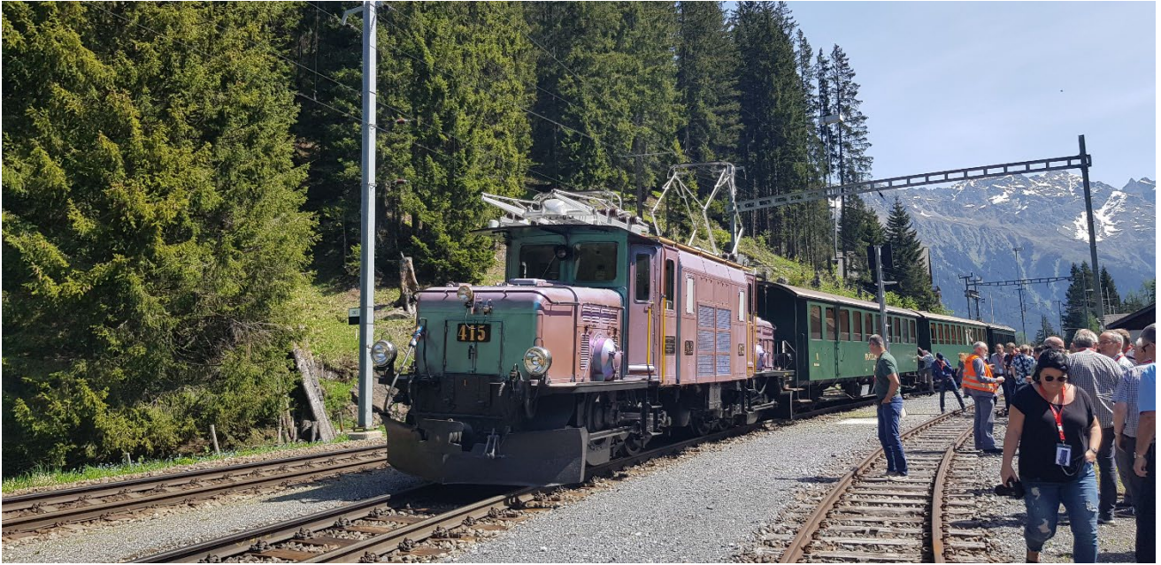
Le train spécial TST du programme traction à Davos Laret